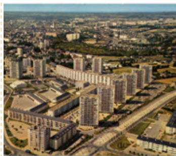
Carte postale du Gros Chêne dans le quartier de Maurepas, Archives départementales d'Ille-et-Vilaine, 6 FI Rennes/943