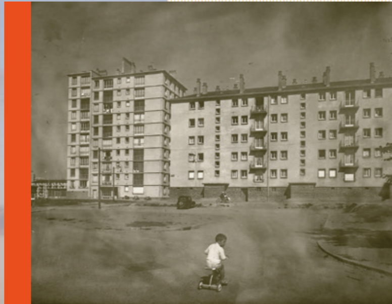
Ensemble Camus-Gros Chêne construit à Maurepas en 1957