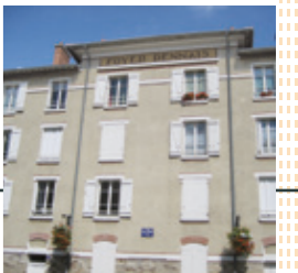
Premier programme de logements à bon marché : Le Foyer Rennais