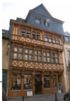
Rue de Saint-Malo

Pour faire face au mal logement et à une demande en forte croissance, construction en nombre de logements sociaux et création des quartiers Cleunay, Maurepas, Villejean et Le Blossne.