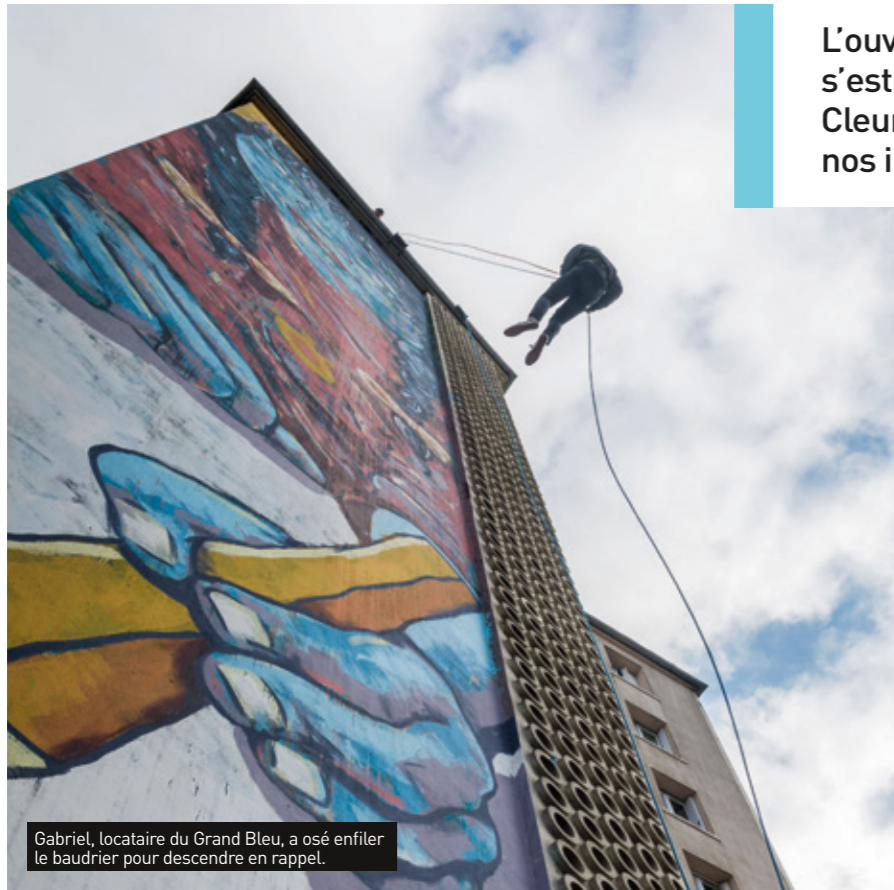
Gabriel, locataire du Grand Bleu, a osé enfile le baudrier pour descendre en rappel.

L'ouverture du festival Urbaines s'est déroulée mi-février à Cleunay sur les parois d'un de nos immeubles, le Grand Bleu.