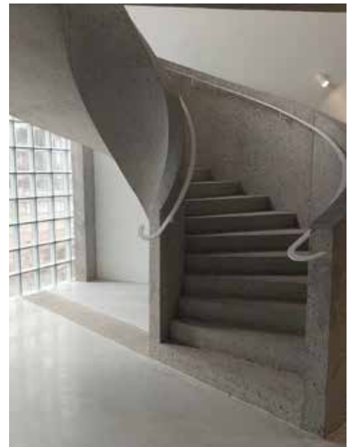
Le Musée des Beaux-Arts en chantier