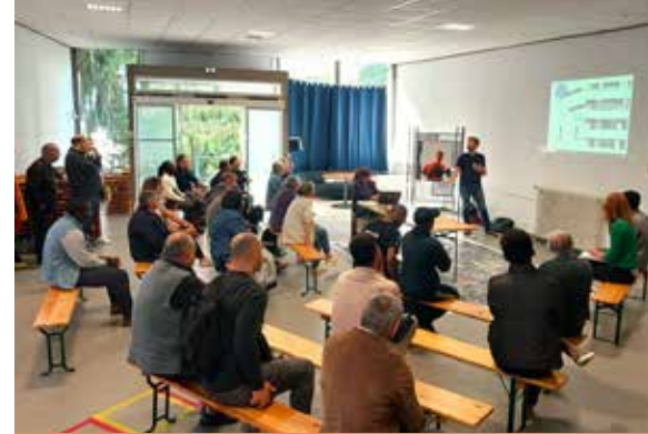
Réunion de concertation avec les locataires

Avec une trentaine de locataires présents sur chaque réunion en plus des représentants des associations de locataires, de l'aménageur (Territoires), des représentants d'Archipel habitat (équipe de proximité ou de maîtrise d'ouvrage), ces réunions sont un moment essentiel du processus projet. Elles font l'objet d'un compte rendu écrit et transmis à chaque habitant et à chaque association de locataires. Un délai de deux mois est donné à chaque locataire concerné, afin de réagir sur les éléments présentés permettant ainsi de valider le programme de travaux de l'opération de réhabilitation.