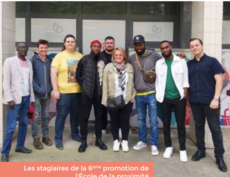
Les stagiaires de la 6 ème promotion de l'École de la proximité

POUR SA SIXIÈME PROMOTION, L'ÉCOLE DE LA PROXIMITÉ CHANGE DE FORMULE. LES APPRENANTS ALTERNENT DES PÉRIODES DE FORMATION THÉORIQUE AVEC DES PÉRIODES DE PRATIQUE DU MÉTIER SUR LE TERRAIN.